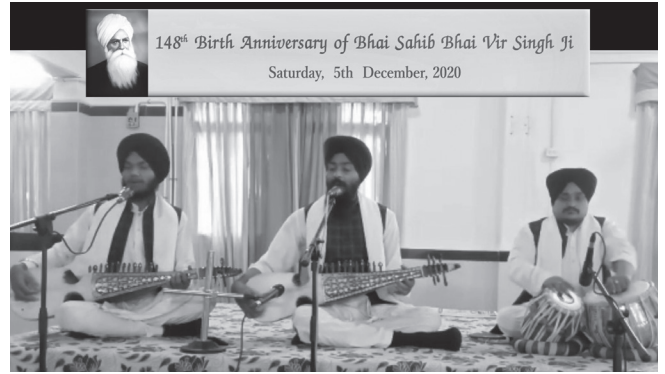
ਗੁਰੂ ਗ੍ਰੰਥ ਸਾਹਿਬ ਵਿੱਦਿਆ ਕੇਂਦਰ ਦੇ ਵਿਦਿਆਰਥੀ ਗੁਰਬਾਣੀ ਦੇ ਰਸਭਿਨੇ ਕੀਰਤਨ ਰਾਹੀਂ ਸੰਗਤਾਂ ਨੂੰ ਨਿਹਾਲ ਕਰਦੇ ਹੋਏ।